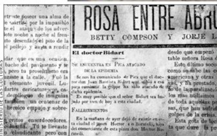
El documento (foto inferior) fue encontrado en un muro del edificio de la exaduana iquiqueña, que resultó destruido por un incendio en 2015.

va, pues es un informativo realizado hace casi 101 años, que aparece justo ahora. Estaba añadido a la tabiquería del edificio y en un recinto de acceso poco frecuente. Además, sobrevivió a las distintas transformaciones interiores del edificio e incluso al incendio que consumió buena parte del mismo", precisa Pedrerós.